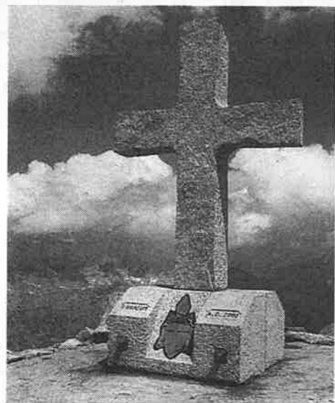
La Croce dell'Adamello dedicata a S.S. Giovanni Paolo II

Sulla Cresta della Croce è stata sostituita la vecchia croce di legno con una nuova di