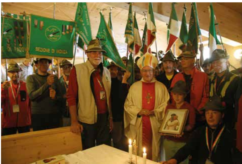
La Celebrazione della Messa è avvenuta all'interno del Rifugio ai Caduti dell'Adamello, sulla Lobbia. Presente l'Arcivescovo di Trento, Mons. Luigi Bressan, e alcuni nostri consiglieri, oltre a diversi Vessilli Sezionali e Gagliardetti.

ciò nonostante il maltempo. A partire dalla cerimonia semplice, quanto sentita, presso il monumento ai Caduti sul corso principale di Tione; presenti una rappresentanza in armi del 2° Reggimento Genio Guastatori alpino di stanza a Trento e la fanfara della Brigata alpina Taurinense che ha scandito i tempi della cerimonia. Attorno al monumento centinaia di Gagliardetti e decine di Vessilli, ma