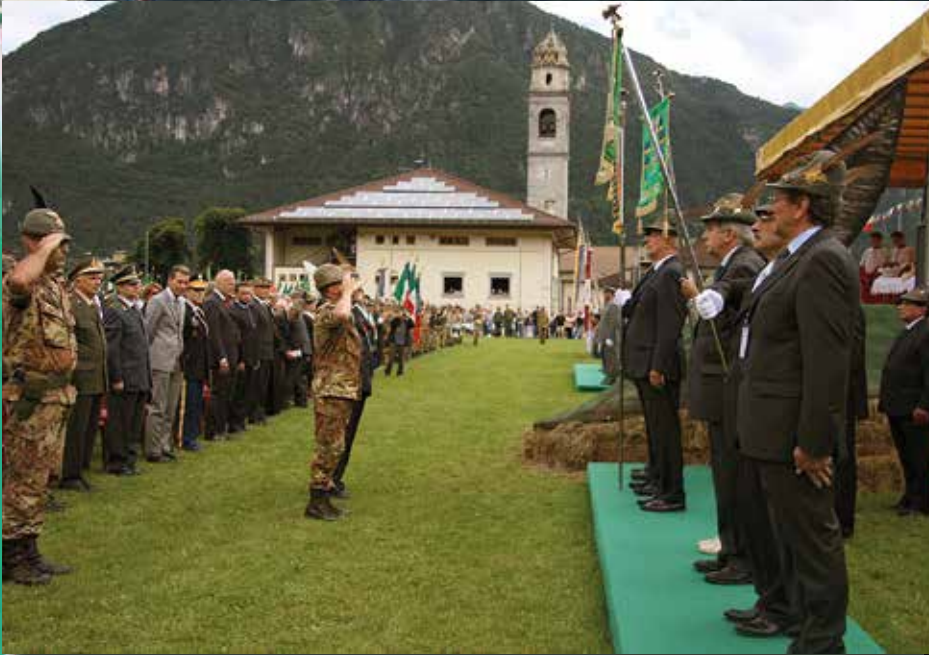
Il Generale Alberto Primicerj, dopo aver fatto il suo ingresso nel campo sportivo di Tione, rende onore al Labaro Nazionale e ai Vessilli delle Sezioni di Trento e della Vallecamonica.