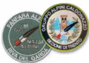
MEDAGLIE E DISTINTIVI Ottone, Argento 925‰ e Oro 18 kt

COPPE E TROFEI GAGLIARDETTI MEDAGLIE RICAMI TARGHE SCULTURE CESELLI IN ARGENTO DISTINTIVI E MONETE BANDIERE E GONFALONI TARGHE COMMEMORATIVE ABBIGLIAMENTO PERSONALIZZATO ARTICOLI PROMOZIONALI E DA REGALO