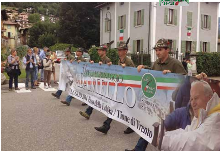
Sopra, i soci del Gruppo Alpini di Tione sfilano portando lo striscione del 51° Pellegrinaggio dell'Adamello. In primo piano Papa Giovanni Paolo II, il Papa Santo, che nel 1988 partecipò al Pellegrinaggio.

Arrivederci all'edizione del 2015, che sarà organizzata dagli amici della Sezione Vallecamonica!