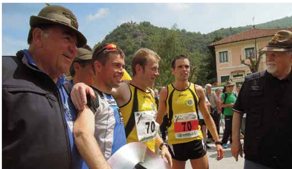
I nostri tre rappresentanti nella staffetta, all'arrivo della gara, ricevono i complimenti del Presidente Nazionale Sebastiano Favero.

Domenica 8 giugno la gara conclusiva, con oltre 600 iscritti alla corsa in montagna individuale a Cer-