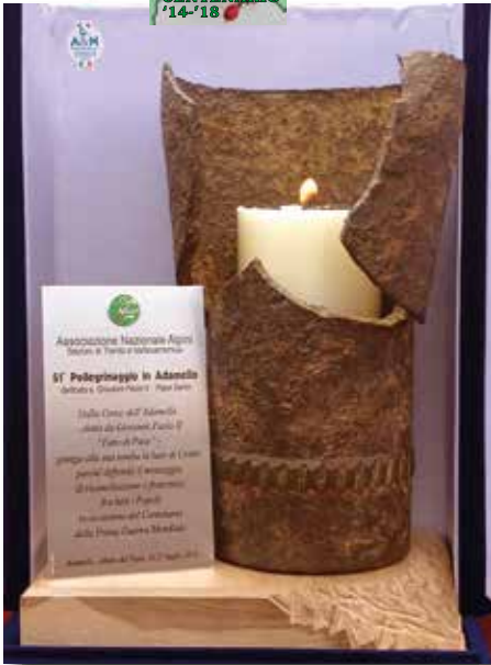
La lampada votiva che è stata consegnata nelle mani del Cardinale Re. Verrà posta sulla tomba di San Giovanni Paolo II.

vissuta in diretta ha raccontato d'un forte coinvolgimento emotivo fra coloro che hanno potuto prendere parte alla S. Messa celebrata nei locali del rifugio dall'Arcivescovo di Trento, mons. Luigi Bressan, ridisceso poi a piedi assieme ai compagni ed accolto a Tione, dove la maggioranza dei partecipanti si era nel frattempo radunata, con manifestazioni di grande ammirazione e stima per l'impresa compiuta. Non meno stupefatti, nel sentire i racconti dell'Arcivescovo, gli ospiti stranieri invitati d'onore alle cerimonie adamelline: i rappresentanti diplomatici di Germania, Romania, Stati Uniti, Francia e Polonia si sono uniti a pellegrini e giornalisti che attorniavano mons. Bressan per avere maggiori dettagli della giornata escursionistica.