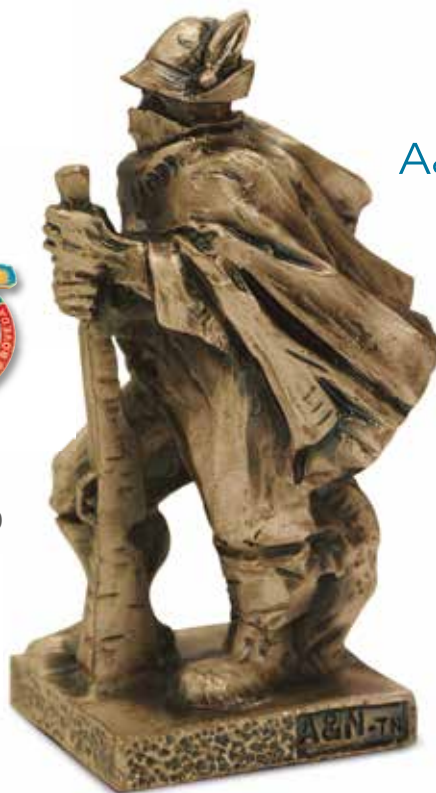
FUSIONI IN BRONZO Opere d'arte di sicuro impatto emotivo