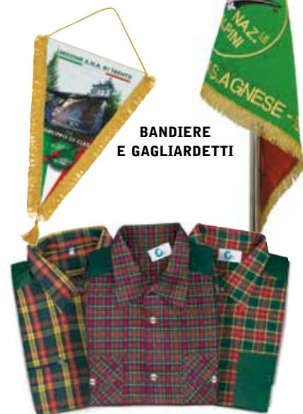
BANDIERE E GAGLIARDETTI