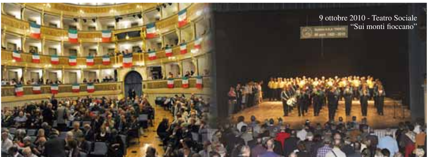
9 ottobre 2010 - Teatro Sociale "Sui monti fioccano"