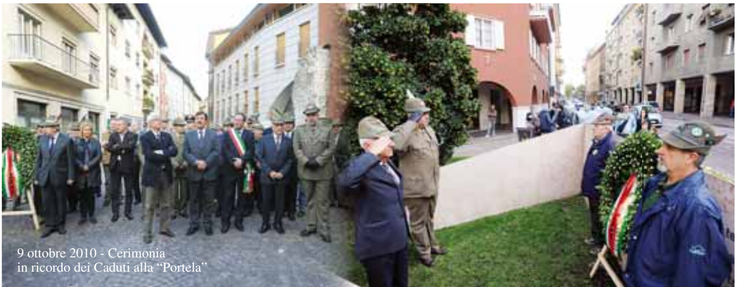
9 ottobre 2010 - Cerimonia in ricordo dei Caduti alla "Portela"