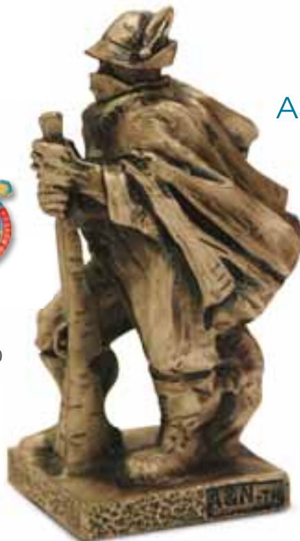
FUSIONI IN BRONZO Opere d'arte di sicuro impatto emotivo