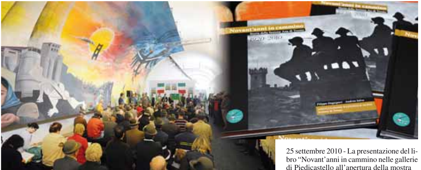
25 settembre 2010 - La presentazione del libro "Novant'anni in cammino" nelle gallerie di Piedicastello all'apertura della mostra