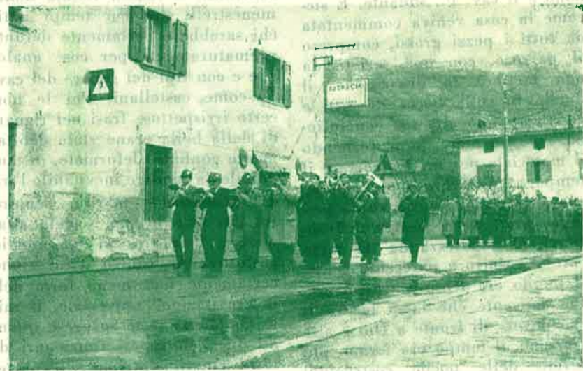
Inaugurazione della fanfara di Pieve di Bono

Domenica 29 novembre 1959 si svolse la festa alpina per l'inaugurazione della fanfara del Gruppo A.N.A. di Pieve di Bono. Per l'occasione sono convenute dalle frazioni numerose penne nere le quali, fra la gioia e l'entusiasmo di un numeroso stuolo di cittadini festeggiarono il piccolo complesso, composto di una ventina di suonatori.