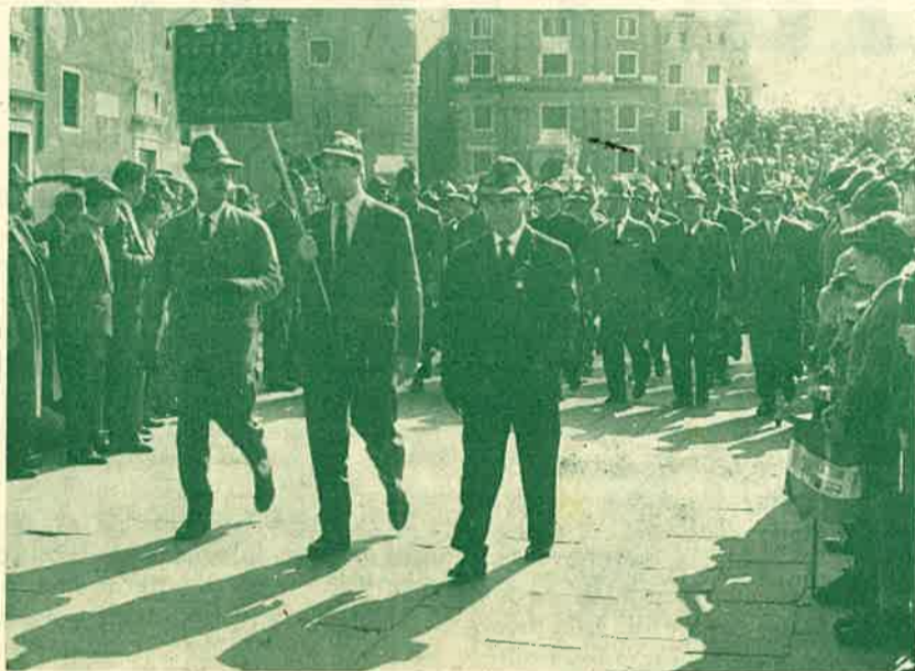
passa il labaro Sezionale