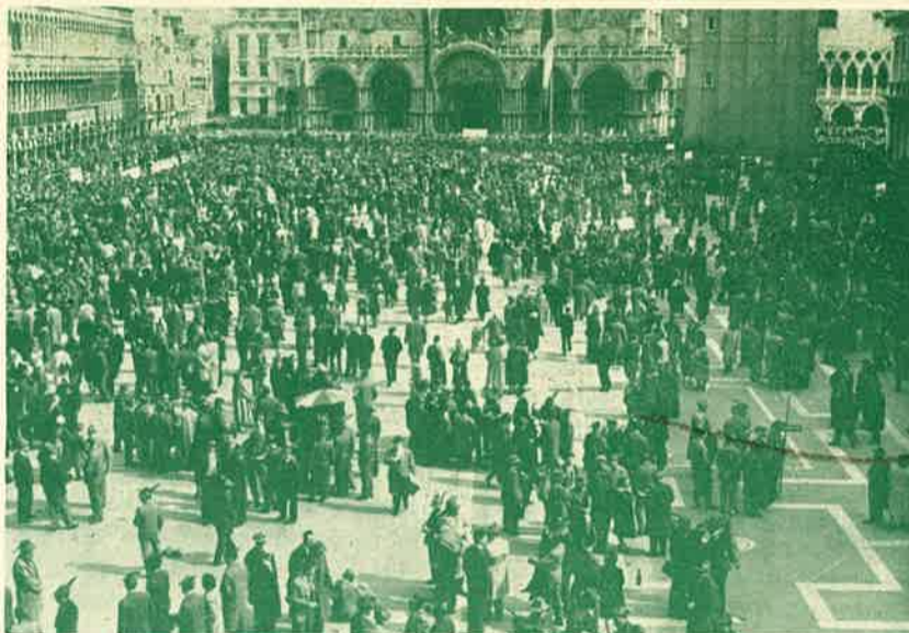
un aspetto di piazza S. Marco appena iniziato l'ammassamento dopo la sfilata