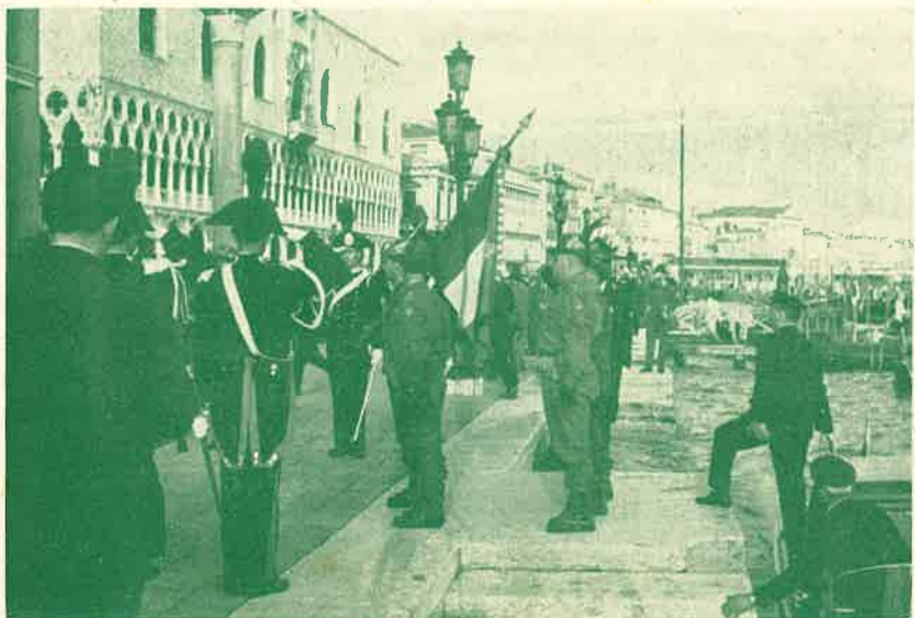
l'arrivo della gloriosa bandiera della «Julia»,