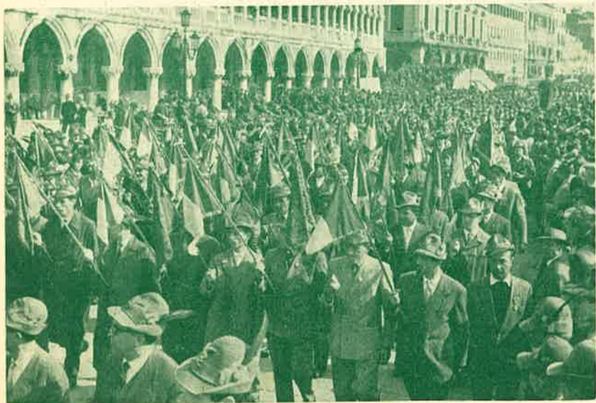
la marea degli Alpini Trentini