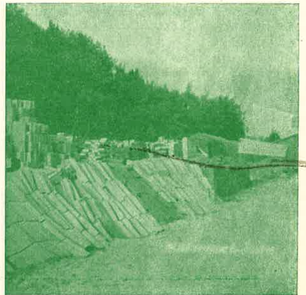
Deposito materiali vari nel Cantiere.