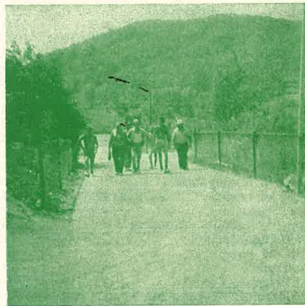
Una squadra rientra al Cantiere dopo il lavoro.

La Sezione di Trento dell'A.N.A., commossa per tale gesto di solidarietà, ringrazia gli amici emigranti.