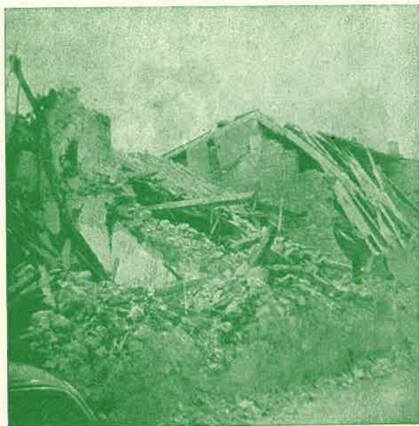
I sopravvissuti hanno bisogno del nostro aiuto.