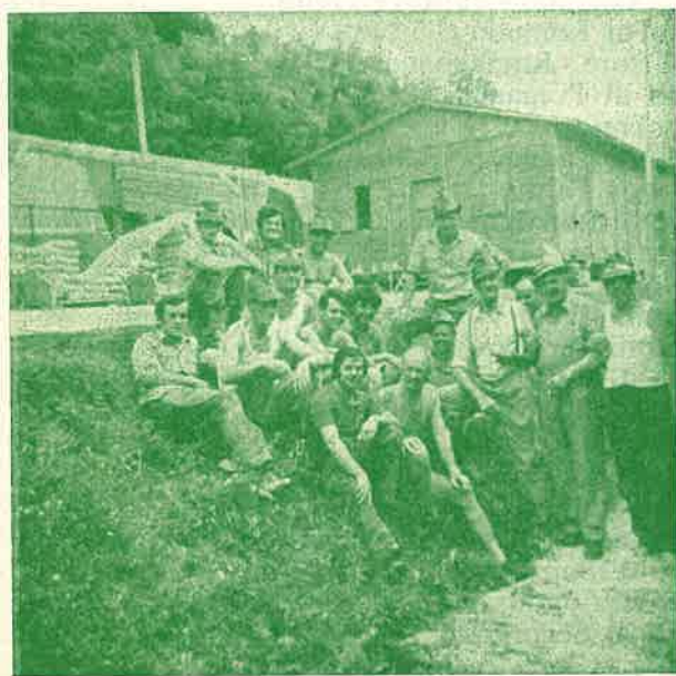
Un gruppo di generosi lavoratori trentini.