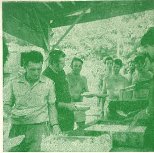
Si ritira il pasto per passare poi nel refettorio.