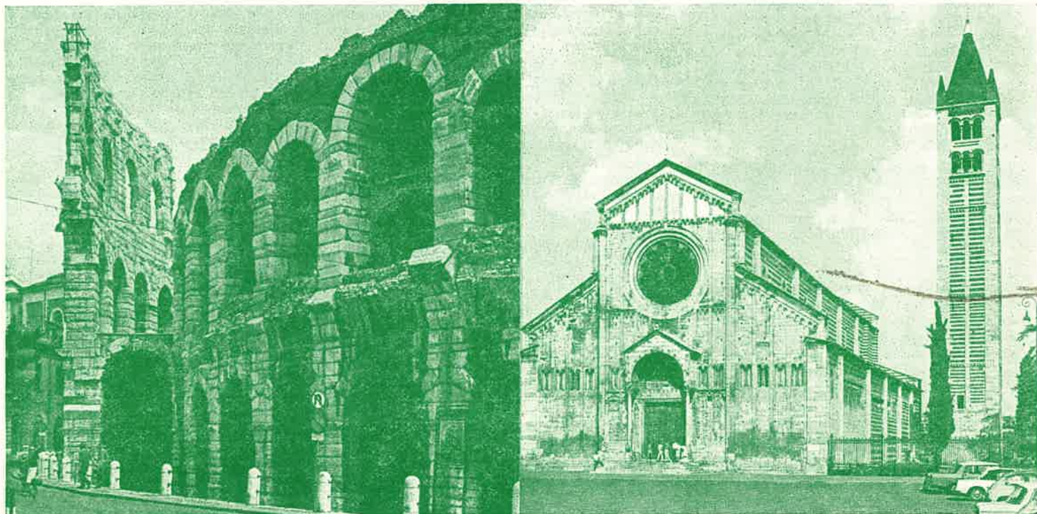
Alpini della Sezione, tutti a Verona per la grande Adunata Nazionale di Maggio!