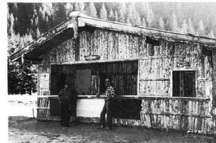
Baita alpina costruita in collaborazione da Gr. ANA Predazzo e G. Artiglieri.