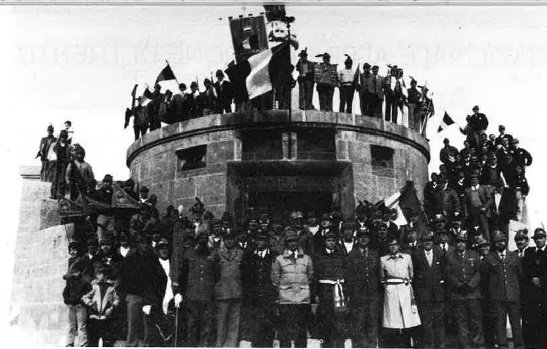
7-10-1984 - Consegna della Bandiera alla Brigata Orobica.

Una magnifica giornata di sole, tra le cime già bianche di neve, ha accolto i numerosi alpini delle Valli di Sole, Pejo e Rabbi, e molti altri giunti da lontano dai Gruppi di Rumo, Cles, Nave S. Felice, Pieve di Bono, Lomaso, Fivè, Marlengo, Temù, Varena, Pezzo... e via dicendo, che si erano dati convegno per celebrare il 112 o Annuale di costituzione delle truppe alpine e la giornata del Tricolore. Fin dal primo mattino i partecipanti sono giunti in massa per festeggiare con vero spirito di amicizia e fraternità alpina questo solenne incontro. Non poteva esserci scelta migliore del Passo del Tonale per celebrare una giornata di grandi significati morali, soprattutto per le gloriose,