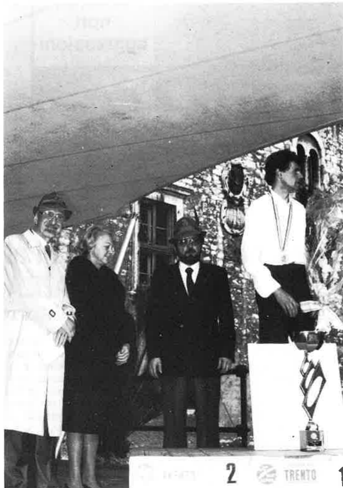
Trofeo «Rinaldo Brocai»: premiazione del vincitore.

Un'edizione straordinaria per un trofeo ormai entrato nella tradizione della città di Trento.