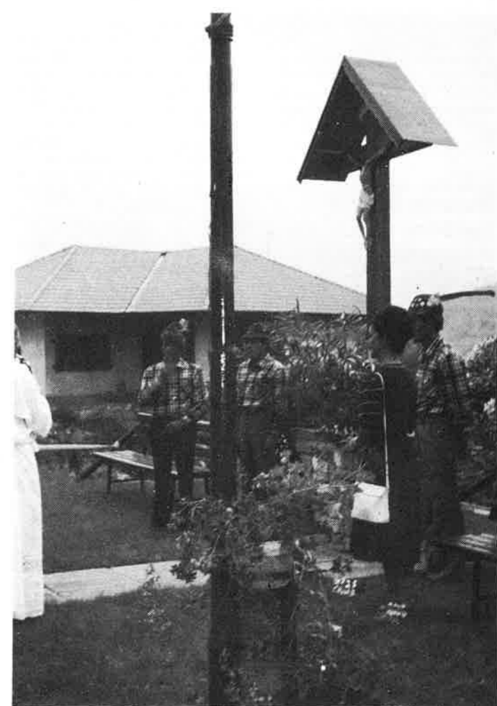
Gruppo di Vigo Cavedine, 19.8.1984 - Festa dell'inaugurazione croce, giardino, muraglione, sostegno fatto e curato da soci del Gruppo A.N.A.

Nel decorso periodo di luglio e agosto i bravi «bocia» del gruppo, dotati di spirito di iniziativa e armati di buona volontà, hanno portato a termine l'aspirazione che da molti anni avevano in cuore i paesani — in particolare gli anziani — di veder ripristinato in località «Cros del melas» l'antico