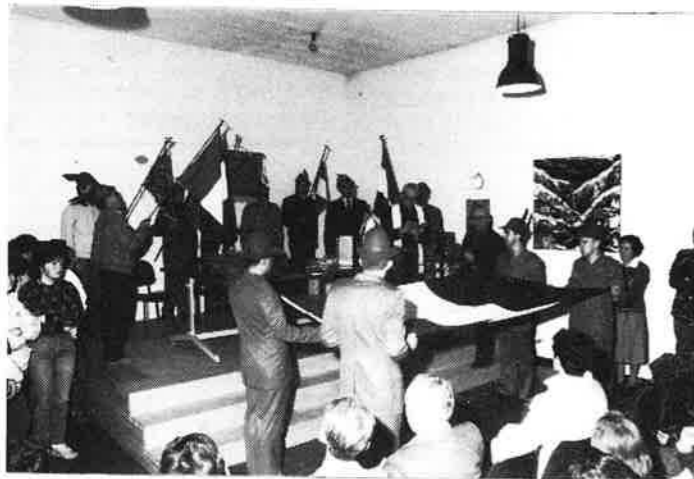
Consegna del tricolore alla Scuola Media «G. Ciccolini» di Malé.

riolgeva parole di elogio agli alpini di Malé per la meritoria e brillante iniziativa; il coro della scuola cantava l'inno nazionale e «Signore delle cime»; il Capogruppo consegnava il Tricolore alla Preside, tra scroscianti applausi. Prendendo la parola il cav. Endrizzi metteva in risalto il significato del dono, aggiungendo che i giovani alunni, come gli alpini, devono amare il Tricolore, simbolo della nostra individualità, della nostra famiglia, della nostra identità di popolo, della nostra civiltà. Anche la Preside additava ad esempio ai suoi alunni il gesto encomiabile degli alpini e si diceva sicura che nelle ricorrenze festive il tricolore esposto sarà per tutta la scuola un richiamo ai valori morali simbolicamente espressi ed esaltati dal generoso dono degli alpini. Di seguito un'alunna, a nome della famiglia scolastica, esprimeva plauso e riconoscenza agli alpini e offriva al Gruppo un quadro ad olio dipinto dagli alunni e un altro consimile lo offriva al Coro Militare dell'Orobica, presente alla cerimonia. I bravi coristi alpini subito ricambiavano, offrendo un applauditissimo concerto, ascoltato con grande entusiasmo in particolare dagli alunni che al termine si univano al complesso, in un unico grande coro per un canto alpino. (13-10-1984)