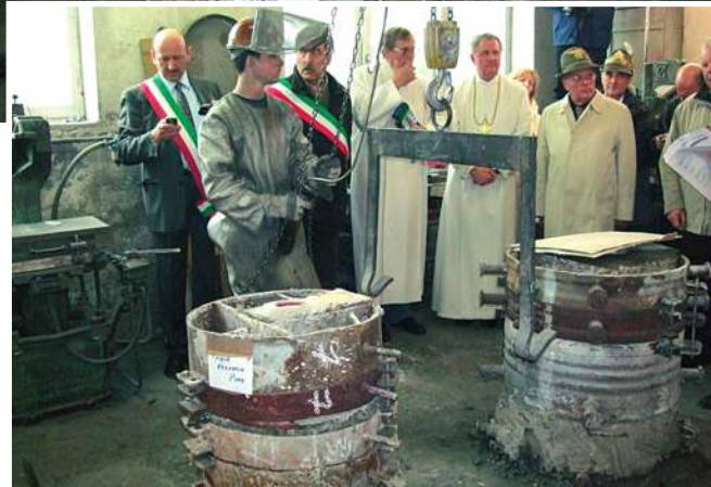
Due momenti della fusione della campana di S. Zita avvenuta alle fonderie Grassmayr a Innsbruck in Austria

alle minoranze linguistiche e traduttore dei testi dall'italiano al tedesco del libro della Chiesetta di S. Zita.