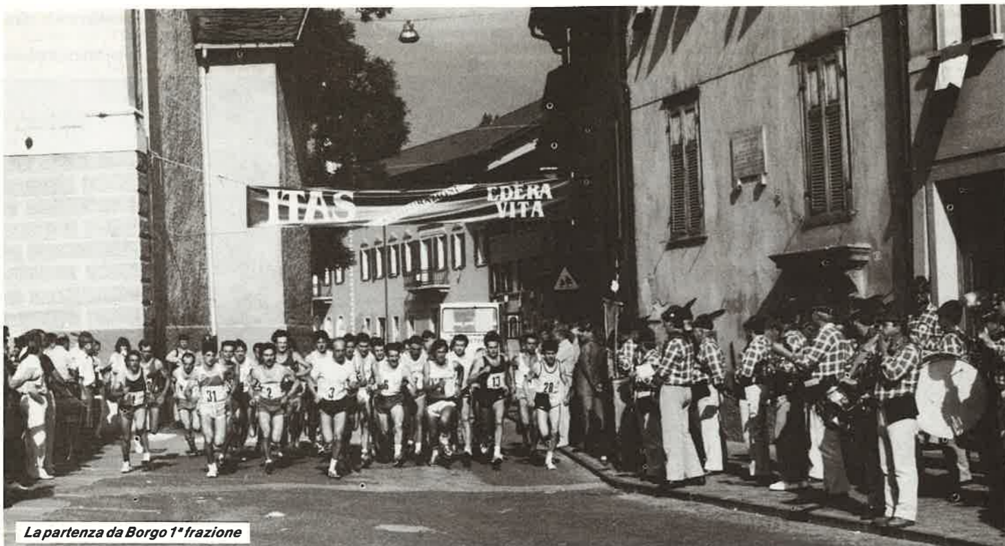
La partenza da Borgo 1ª frazione