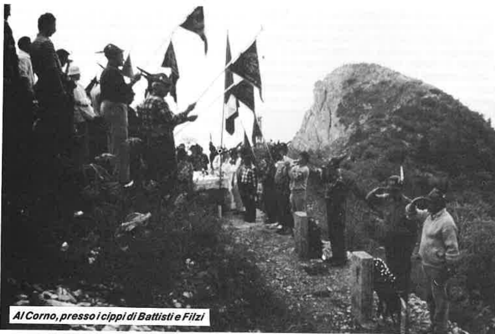
Al Corno, presso i cippi di Battisti e Filzi