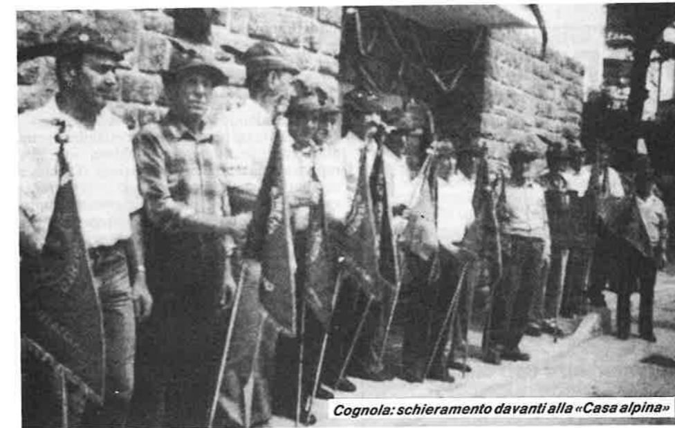
Cognola: schieramento davanti alla «Casa alpina»

In questi ultimi giorni si sono svolte due diverse manifestazioni promosse la prima dal Gruppo alpini di Cognola per l'inaugurazione della propria sede al pianterreno della casa comunale di via Pellegrina, 2, la seconda per la consegna della bandiera alla scuola elementare «Natale Tommasi» da parte del Gruppo alpini di Villamontagna. In ambedue i casi c'è da sottolineare — per prima cosa — la grande solidarietà e l'amicizia che esistono fra i gruppi alpini, presenti numerosi — e non a caso — alle due manifestazioni con i loro gagliardetti. Significativa anche la presenza della sezione