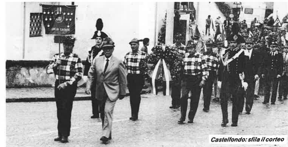
Castelfondo: sfilata il corteo

Domenica 24 aprile scorso il gruppo di Fondo ha organizzato una bella festa alpina inizia-