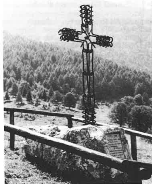
1915-'18: il ricordo di una croce a malga Campo.

Nozze di diamante tra Arco e gli alpini del gruppo che ha compiuto i 60 anni di fondazione. Sfilata per le vie della città, deposizione di corona al monumento dei Caduti, santa messa alla Collegiata, meravigliosa esibizione della Fanfara dei Laghi ed a Prabi rancio, musica, allegria; il tutto allietato da un sole che ha accompagnato gli alpini con tanta benevolenza.