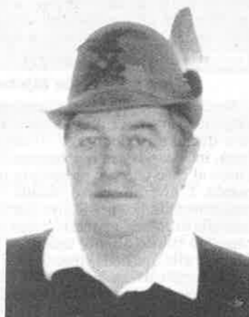
Sindaco di Mazzin di Fassa